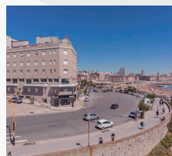
HOTEL PUNTA PIEDRAS