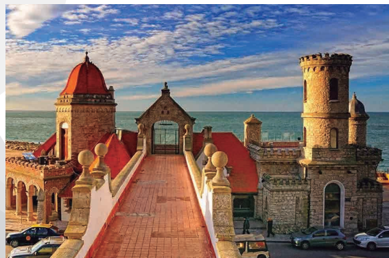
MAR DEL PLATA