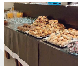
HOTEL AV. DEL MAR