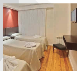
HOTEL AV. DEL MAR